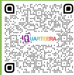
Beratung zu Asyl und Aufenthalt

Achtung: Ohne Termin können wir leider eine Beratung nicht garantieren.