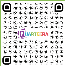
Консультации по вопросам убежища и проживания

Важно: к сожалению, мы не можем гарантировать консультацию без предварительной записи.