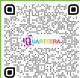
Консультації з питань отримання притулку та проживання

Важливо: на жаль, ми не можемо гарантувати консультацію без попереднього запису.